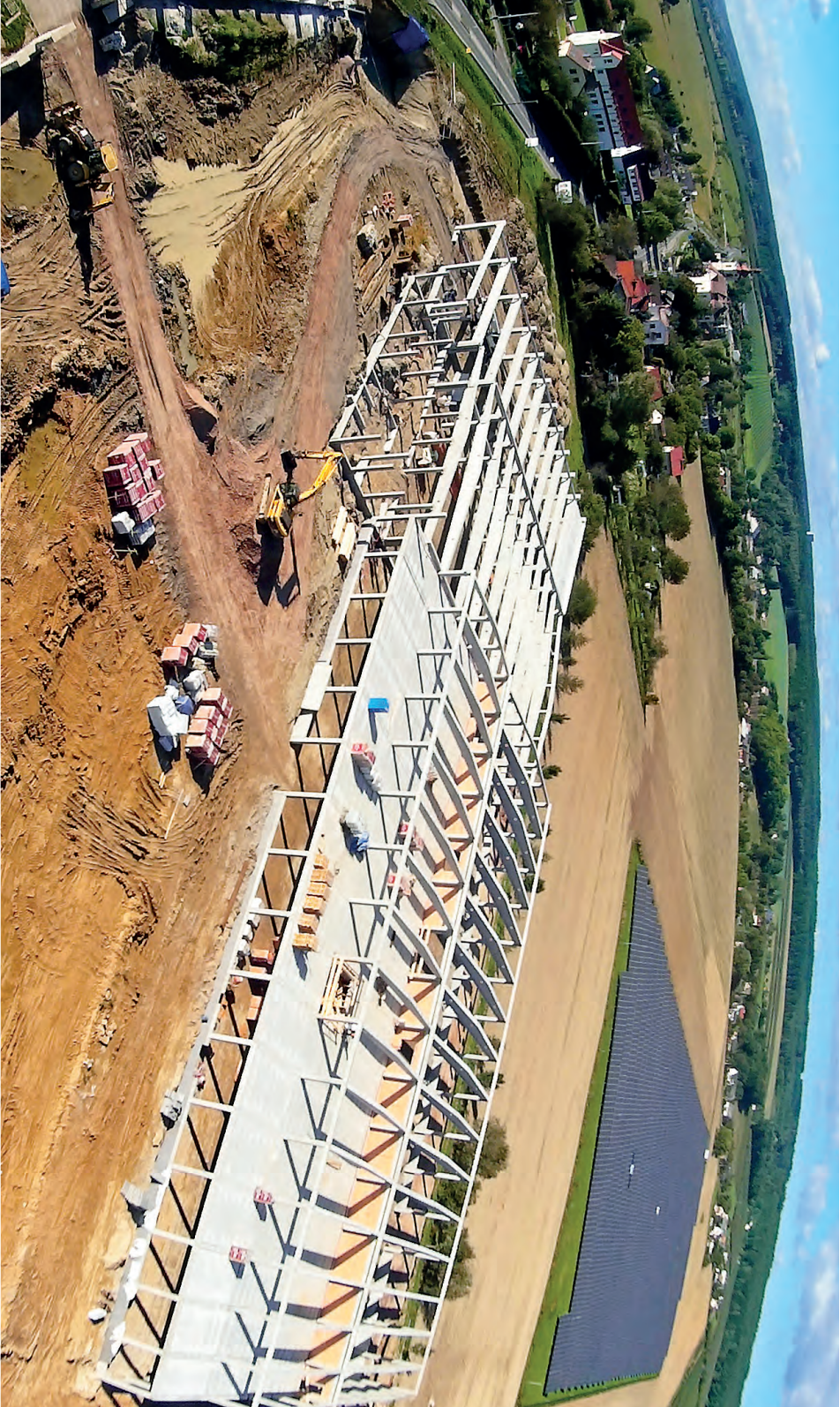
□ Stavba nové "sesterské ličenské" pekárny BEAS a.s. v Choustníkově Hradišti.