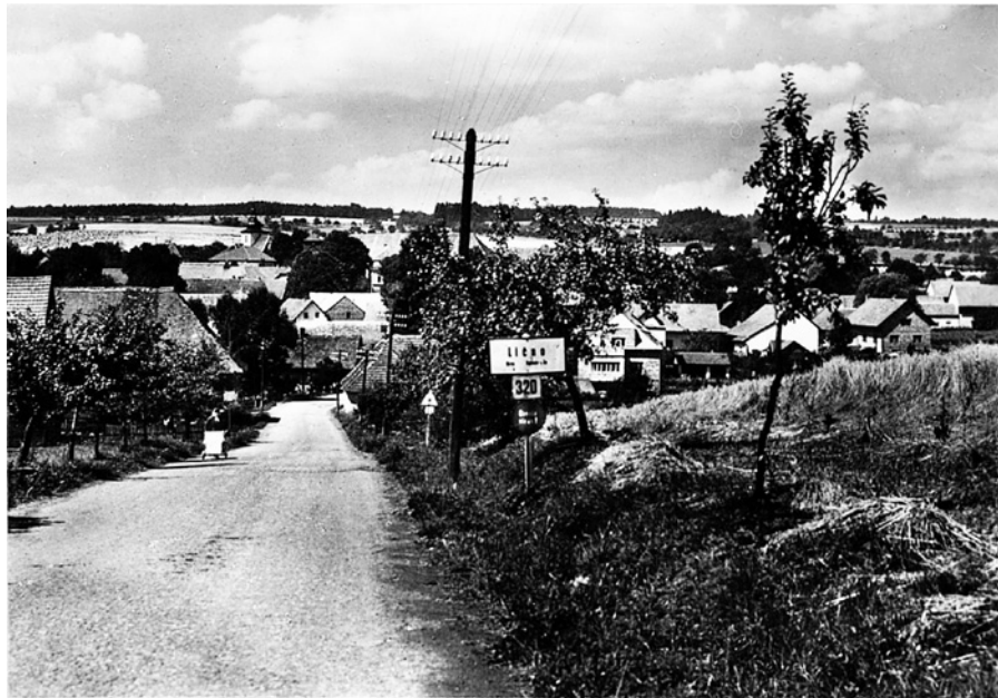
celkový pohled na Lično směrem od Třebešova asi 50. léta