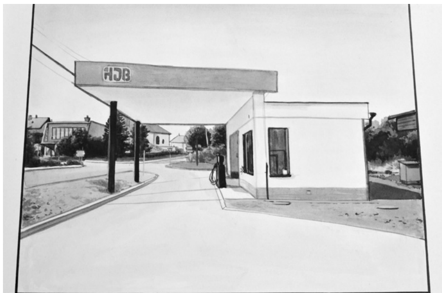
Čerpací stanice firmy HDB (Hřebíky - Dvůřák - Kralov) vystavěná Východočeskou stavební spol. v období od 10.3. do 3.6.1984 na pozemku, což byl ještě za minulého režimu vykoupen od Václava Čepelky a po demolicí jeho stavění zde měla státněna být prodána potravinu.