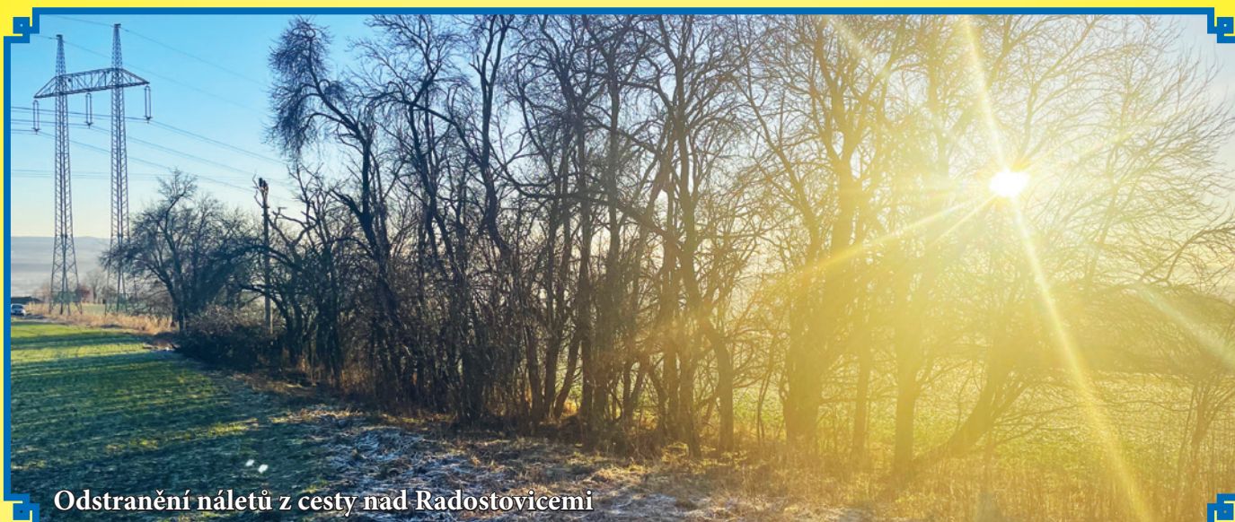
Odstranění náletů z cesty nad Radostovicemi