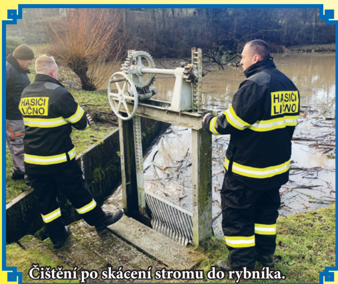
Čištění po skácení stromů do rybníka.